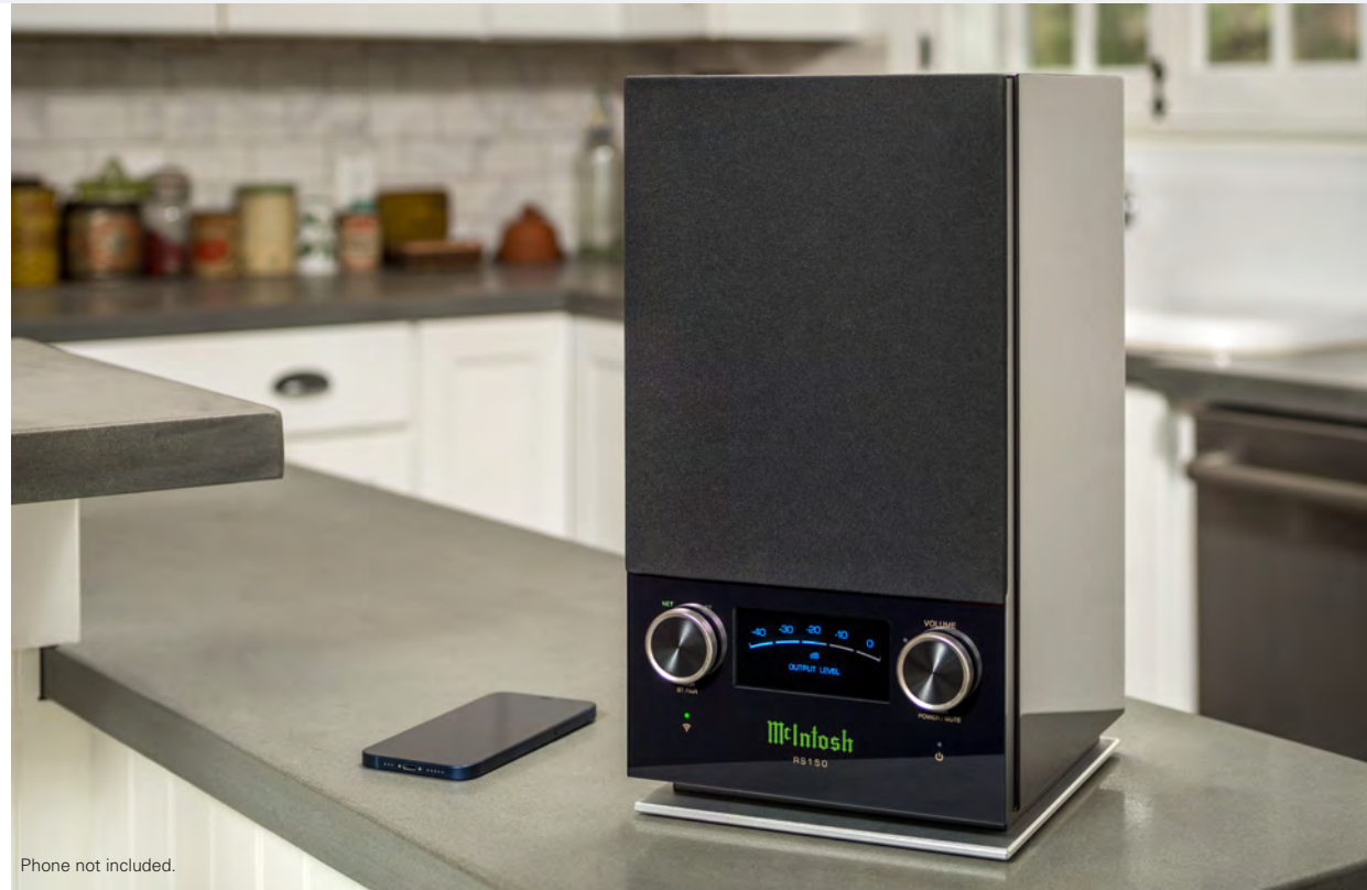
Phone not included.